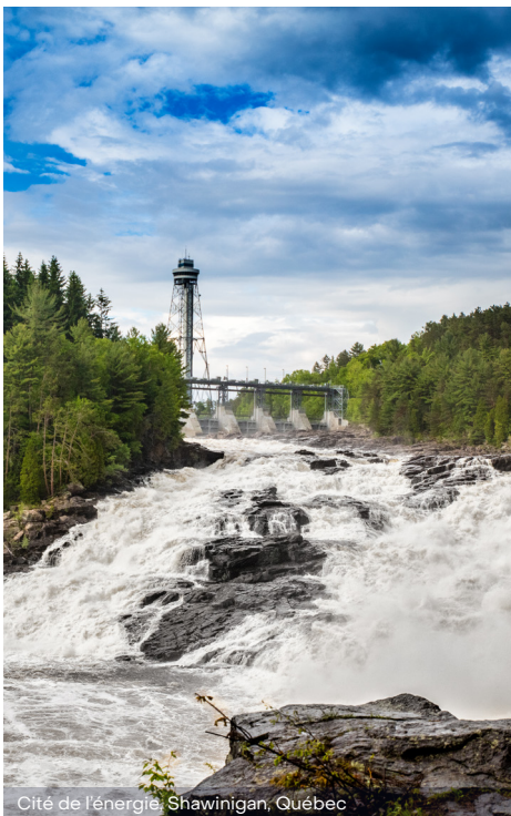
Cité de l'énergie, Shawinigan, Québec